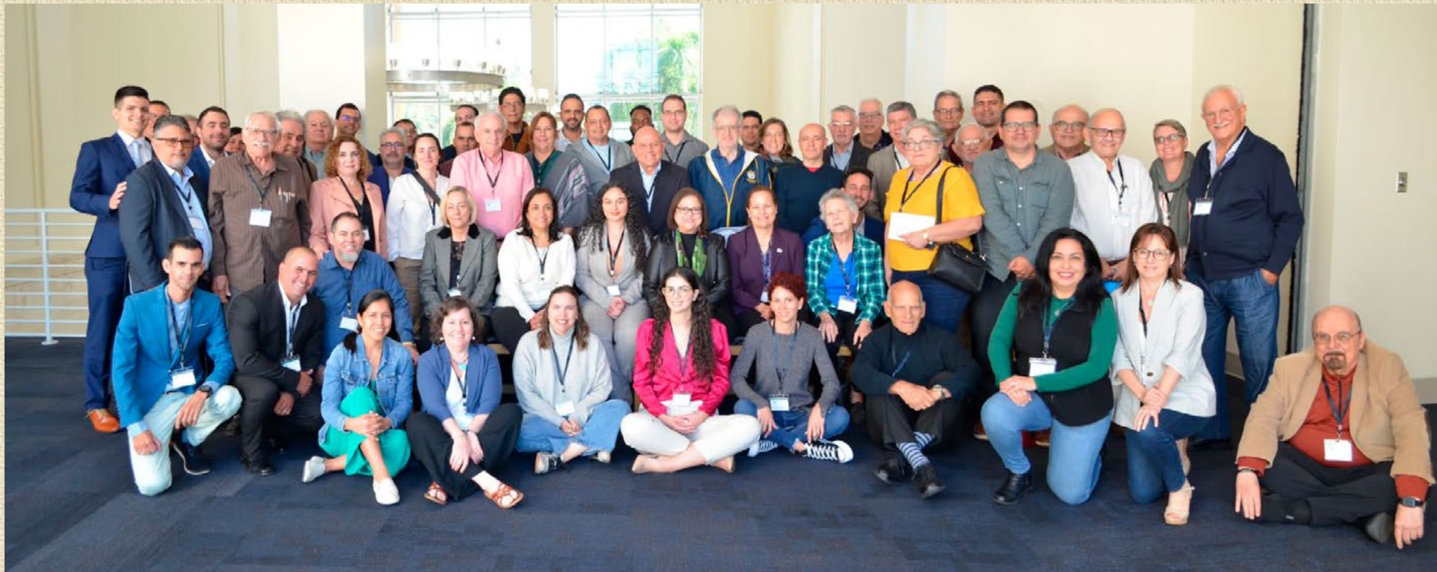
Participantes en el IX Encuentro del Itinerario de Pensamiento y Propuestas para Cuba, Universidad Internacional de la Florida, 24 de febrero de 2024.