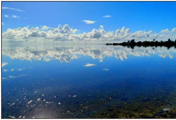
Santa Rita: La península del cielo.