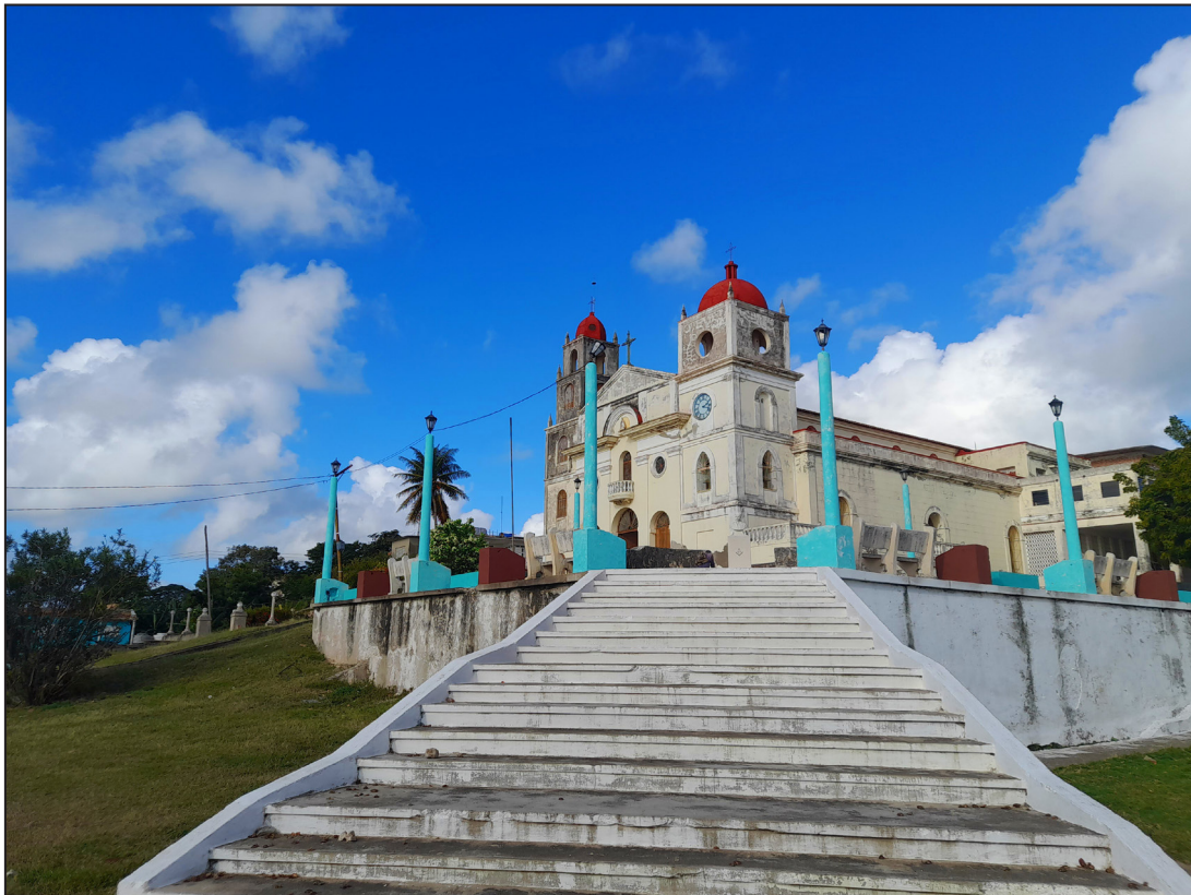
La entrada nunca está donde se suponía.