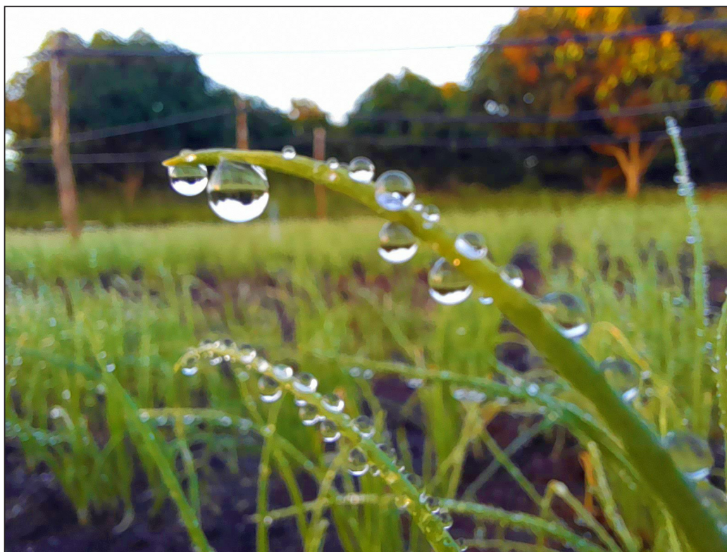
El amor, como la primavera, hace florecer hasta los espinos.

Años más tarde, Ricardo se vincula al periodismo independiente trabajando en reconocidos medios como 14ymedio , La hora de Cuba y otros.