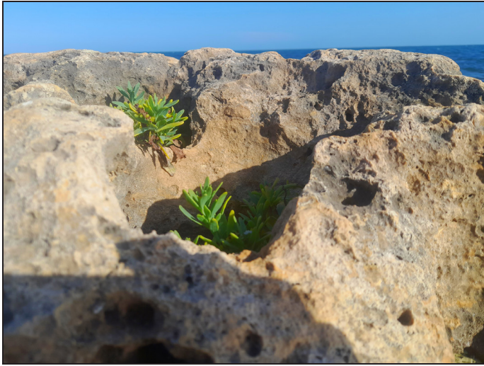
Colonizando la inmensidad del mar, una isla a la vez.