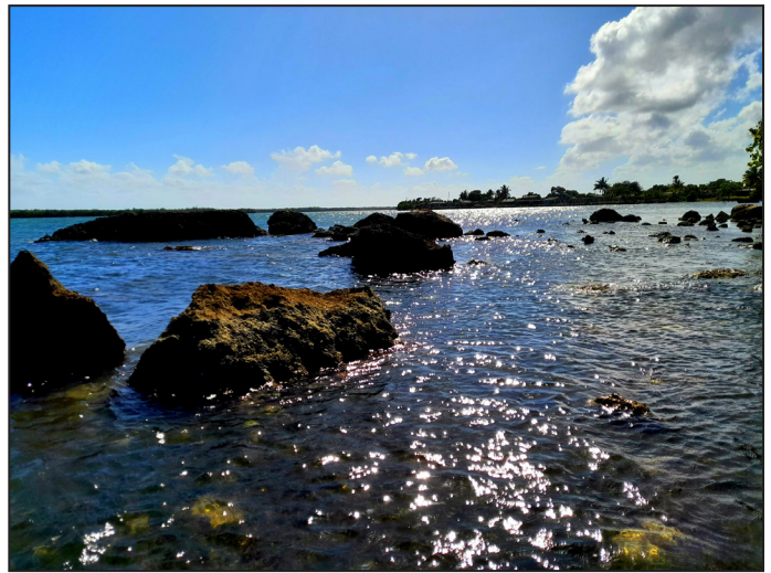
Rodeados de Islas bañadas de sol.