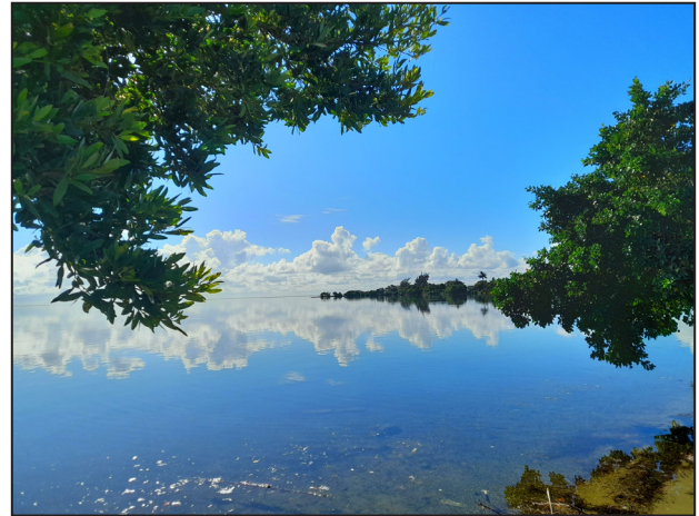
Santa Rita: La península del cielo.