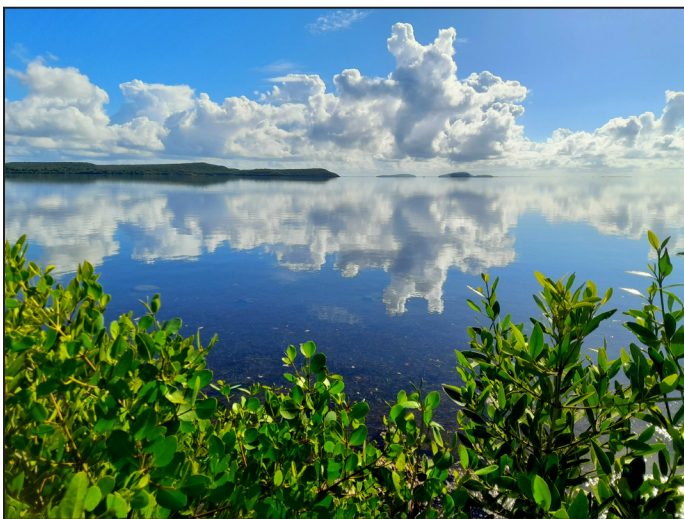
Si encuentras pliegues en el cielo, no es cielo, es un simple imitador que se cansó de ser mar.