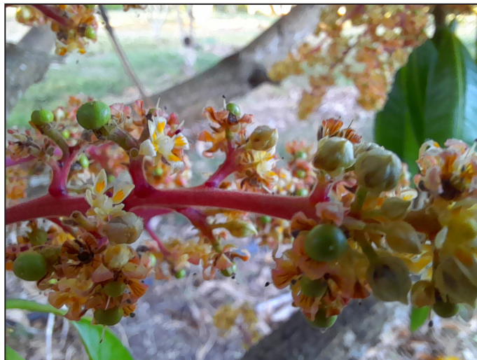
Con todas las etapas dentro (El mango). Foto de Ricardo Fernández.

El amor, como la primavera, hace florecer hasta los espinos. Foto de Ricardo Fernández.