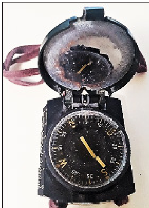
Brújula que trajo mi tío de Cuba en 1979.

Abramos bien los ojos. En estos momentos miles de hombres, en tu mismo vecindario, en tu iglesia, en tu país, quieren rehacer sus vidas, transformar sus conductas, liberarse del mal, pero caminan desorientados sin saber adónde ir. Necesitan de un Guía y de una Luz que ilumine sus pasos; de una brújula que, como la de mi tío, los lleve a puerto seguro y los haga libres.